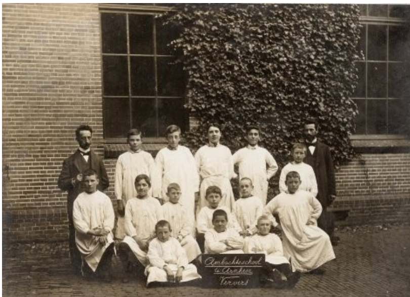
Op bordje: Ambachtsschool Arnhem Ververs

De minister geeft blijkens het jaarverslag 1918/9 echter de voorkeur aan het particulier initiatief, 'waardoor het ambachtsonderwijs zich zoveel mogelijk vrij kan ontplooiën'. Wel krijgt de delegatie de toezegging, dat de Rijkssubsidie zal worden verhoogd en wordt bij eventuele uitbreiding medewerking toegezegd. Ondertussen is al van 1914 af een ontwerp van een 'Nijverheidsonderwijswet' in de Staten-Generaal aan de orde, dat eindelijk op 4 oktober 1919 wet wordt. Zij treedt op 1 januari 1921 in werking en daarmee is dan het schoolbestuur voor het overgrote deel uit de zorgen.