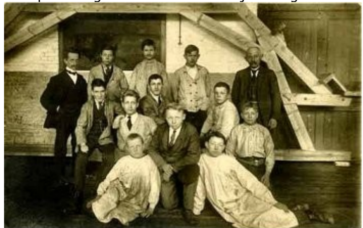
Bijlschrift: acht metselaars en drie schilders.

Het schoolbestuur zit met de handen in het haar. Stijging van materiaalkosten, salarissen en van het aantal leerlingen hebben grote financiële moeilijkheden veroorzaakt, waarbij bovendien dan nog geconstateerd wordt dat de inbreng van particuliere contributies gestaag minder wordt.