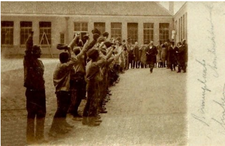
Tekst op kaart : Ambachtsschool binnenplaats

bachtsschool gratis in gebruik van de gemeente. Omdat nu de minister van mening is, dat voor de school in een goede huisvesting is voorzien, bevordert hij dat de Koning de gemeente weer ontheffing verleent van de verplichting tot het oprichten van een Burgerdag-school.