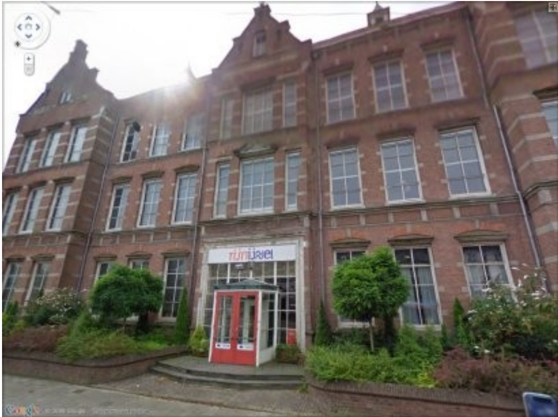
Een lege school.

in Technische School. De in 1962 in Malburgen gestichte dependance wordt met ingang van 1 augustus 1970 een zelfstandige school. Van die datum af is er sprake van de Eerste en de Tweede Technische School (resp. aan de Boulevard Heuvelink en het Middelgraafpad). Als in 1972 de Tweede Technische School wordt opgenomen in de Scholengemeenschap voor Beroepsonderwijs 'Vredenburg' (waarin ook opgenomen is het LHNO-gedeelte van de Koninklijke Scholengemeenschap voor Beroepsonderwijs aan de Rijnkade) dan wordt de oudste, nu honderd jaar bestaande school aangeduid als Technische School 'De Boulevard'.