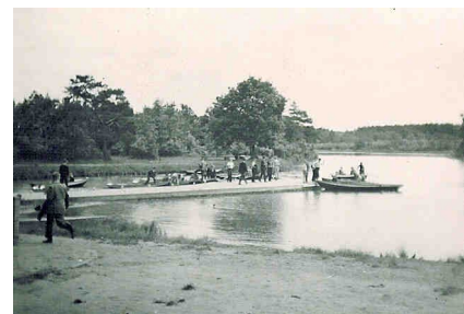
Kanovijver van de Efteling

Een nieuw fenomeen kwam in het jongensbolwerk, toen er een kapsters opleiding kwam. 'Ik denk dat ze een vorm van leerlingstelsel volgden, want ze waren er niet iedere dag. Je kwam ze nooit tegen. Alleen als je tussendoor naar het toilet ging. De meisjes kwamen pas binnen als de jongens al in de klas waren en gingen weg voor de jongens met middagpauze gingen. Om bij hun lokaal te komen moest je via de hoofdingang aan de Boulevard Heuvelink de trap op. Dan de eerste deur links naast de trap. (Daar is anno 2003 een directie kamer.) Jammer voor ons werd het raam op de deur geblindeerd. Toch probeerden we tussen de kieren door te gluren. Geweldig spannend om niet betrap te worden.'